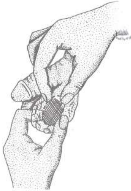
Figura 2 - Palpação do epidídimo pela manobra de Chevassu.