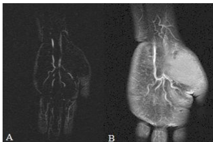
Figura 3. Imagens coronais de Angiorressonância Magnética (A) e Ressonância Magnética ponderada em T1, após a infusão do contraste paramagnético (B), demonstrando artéria mediana persistente.

presença da variante anatômica supra-citada, sem sinais de estenoses, obstruções ou dilatações aneurismáticas. (Figura 3)